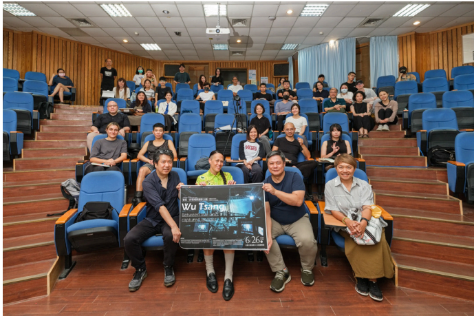
6/26【當代藝術大師講座】—「曾吳：於現場與擷影之間」於北藝大舉行。