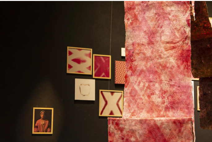
阮原閔《一身的紅》(台東美術館提供)