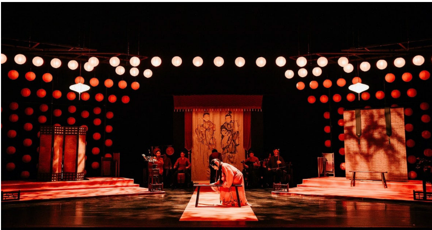
江之翠劇場《行過洛津》